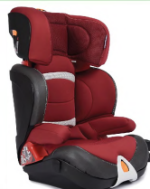
Автокресло группы III для детей массой 22-36 кг (включая устр-ва с расклад. бустерами)